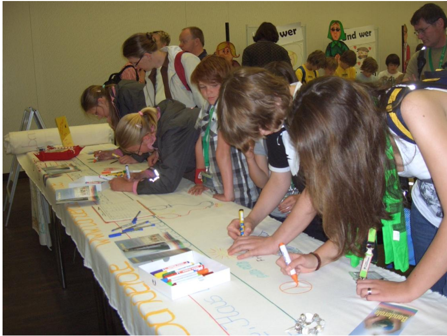
Junge und erwachsene Besucher des Kirchentages beim Malen ihres Friedensbildes auf die FRIEDENS-BANDEROLE, die an den beiden ersten Tagen im kleinen Saal des Museums aufgebaut war und danach ins Foyer wanderte.