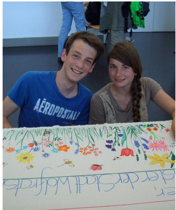
Die beiden jungen Menschen (Foto rechts) hatten schon im Vorfeld von der Friedens-Mal-Aktion gelesen und es war ihnen eine Herzensangelegenheit, sich auf der FRIEDENS-BANDEROLE einzutragen und ihr Friedensbild darauf zu malen. „Frieden ist so schön wie eine farbenfrohe Blumenwiese!“