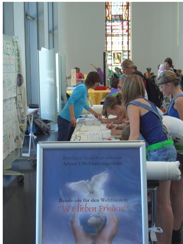
Die Friedens-Banderole im Foyer des Deutschen Hygiene-Museums in Dresden.